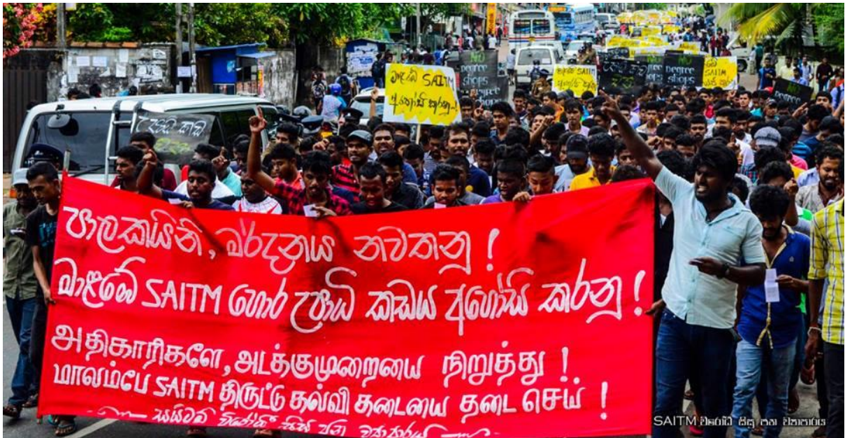
2016/07/27 දින සයිටම් විරෝධී සිසු ජන ව්‍යාපාරය මගින් නුගේගොඩ දී සංවිධානය කල පා ගමන සහ රැලිය.

෧ ක වූ වසරක කාලය ශ්‍රී ලංකාවේ අධ්‍යාපනය සම්බන්ධයෙන් ධනාත්මක වර්ධනයක් පෙන්වූ කාලපරිච්ඡේදයක් ලෙස දැක්විය හැක. එනම් ජනවාරි 8 දින ජයග්‍රහණය කරනු ලැබූ ප්‍රතිපත්තිය පොරොන්දු එක්තරා ප්‍රමාණයකින් ඉෂ්ට කිරීමට වර්තමාන රජය මැදිහත් වීම මෙම කාලය තුළ දක්නට ලැබුණි. කෙසේ නමුත් රාජපක්ෂ රජයේ නිශේධාත්මක අංගයන් ද වර්තමාන රජයේ ක්‍රියාකාරකම් තුළින් යම් ආකාරයකට දක්නට ලැබීමද සැලකිය යුතුය. මෙම ලිපියේ මූලික අරමුණවන්නේ 2015 අගෝස්තු 17 සිට 2016 අගෝස්තු 17 දක්වා වූ වසරක කාලය තුළ අධ්‍යාපනය සම්බන්ධයෙන් වූ සිදුවීම් පිළිබඳ විමර්ශනයක් කිරීමය.