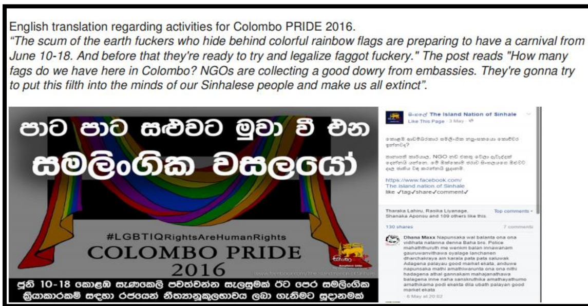
Screenshot of threatening facebook posts made by 'Island Nation of Sinhale'