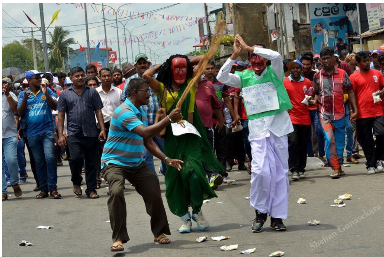
Padayathra protest by the joint opposition

Commitments to rights are tested mainly in adverse situations. This is true for State as well as non-state actors. As the present government marks one year, despite laudable democratic achievements of the government, cracks have started to appear in the sphere of democratic rights.