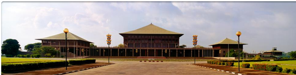
Photograph 1.1 Parliament of Sri Lanka

“Since then the parliament which is functioning as a constitutional assembly of all its members lead by a steering committee and several sub committees is said to be debating both the PRC report and other representations and ideas for a new constitution. This process remains under closed doors and thus shrouded in secrecy which in itself goes against the very principles of democratic governance and transparency the public demanded should be firmly enshrined in a new constitution.”