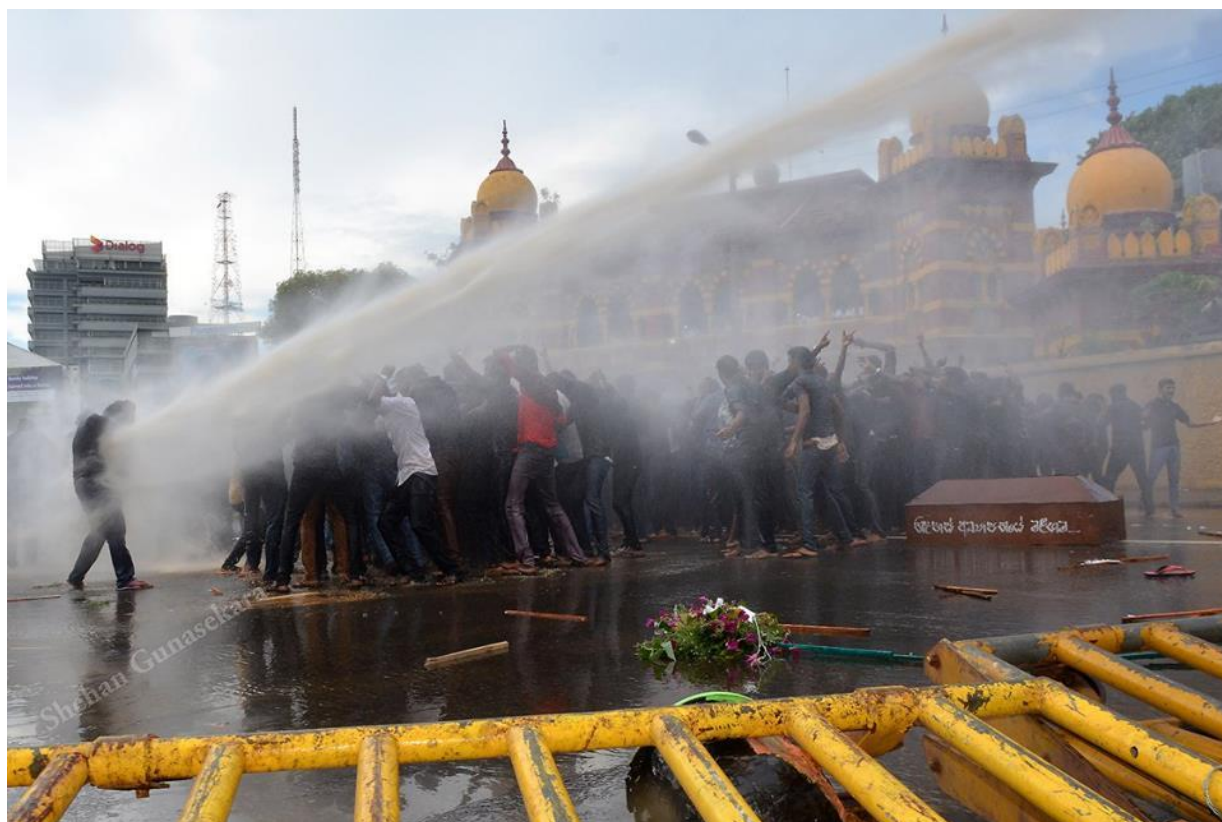
Protest of HNDA students was attacked. 29 th October 2015, near Townhall in Colombo

Notwithstanding the fact that the Rajapaksa led march was aimed at inciting extreme Sinhala nationalist feelings and to sabotage democratic reforms of the government, their right to protest and peaceful assembly should have been respected.