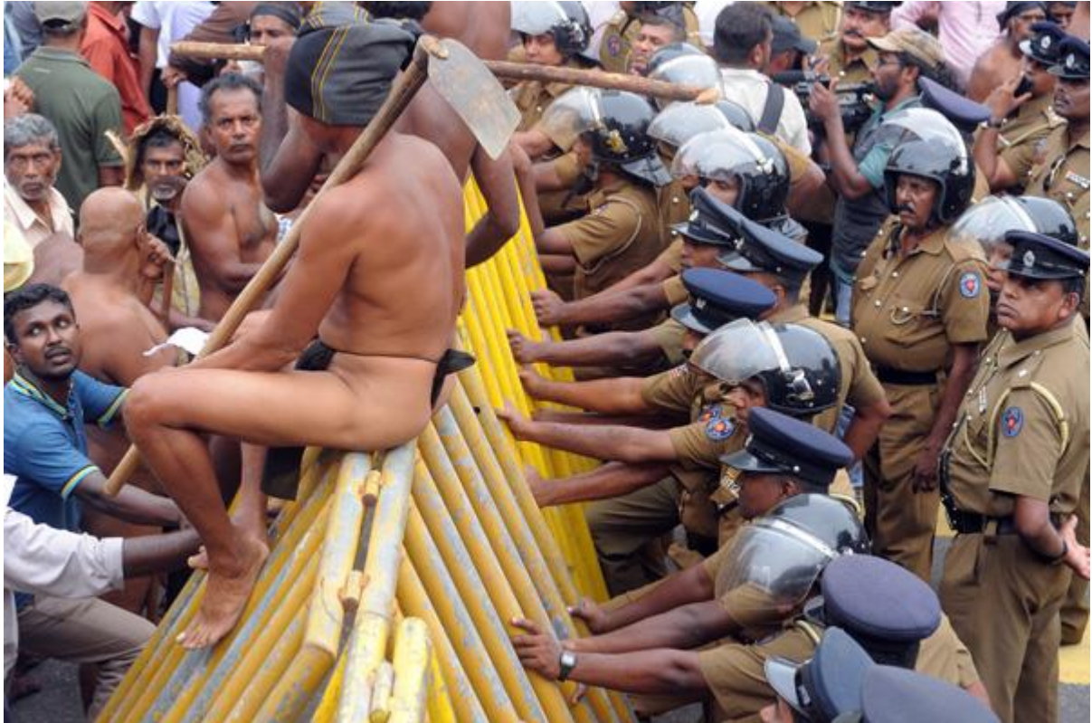
ඡායාරූපය- පොහොර සහනාධාරය නැවැත්වීමට එරෙහිව උද්ඝෝෂණයේ යෙදෙන ගොවීන්, 2015 දෙසැම්බර් 17 දින කොළඹ අරලිය ගඟ මන්දිරය ඉදිරිපිට.

2015 ජනවාරි 08 වෙනිදායින් පසු මේ රටේ සිදුවූ පරිවර්ථනය සැබෑ ලෙසට රජයක් ලෙස පරිවර්තනය කරනු ලැබුවේ 2015 අගෝස්තු 16 වන දිනයි. එහිදී වසරක ප්‍රගතිය විමසා බැලීමේදී තවදුරටත් රජය අපේක්ෂා කළ හා ක්‍රියාත්මක කළ යුතුව තිබූ ප්‍රධාන අවශ්‍යතා මෙන්ම ජනතාවගේ අභිලාශයන් මුණ ගැසීමට හැකිවූවාද යන්න ප්‍රභල මාතෘකාවක් බවට අද පත්ව තිබේ. විශේෂයෙන් ජනවාරි 08 විප්ලවයෙන් පසු එම ජනතාවාදී න්‍යාය පත්‍රයක් තුළ පොරොන්දු වූ සියළු වගකීම් හා වගවිම්වලින් තොරව අතහැර දමා ඇති බව පසු විමර්ශණය නිසි ලෙස කළ විට හැඟී යනු ඇත. රටක අනාගත වර්ධනය සඳහා හේතු විය හැකි ප්‍රධාන අංශ දෙකක් වනුයේ කෘෂිකර්මය සහ පරිසරයයි. එය දීර්ඝ කාලීන සැලැස්මක් සහිතව පෙර සූදානම් රාශියක් සහිතව සිදුකළ යුතු අඛණ්ඩ ක්‍රියාවලියකි.