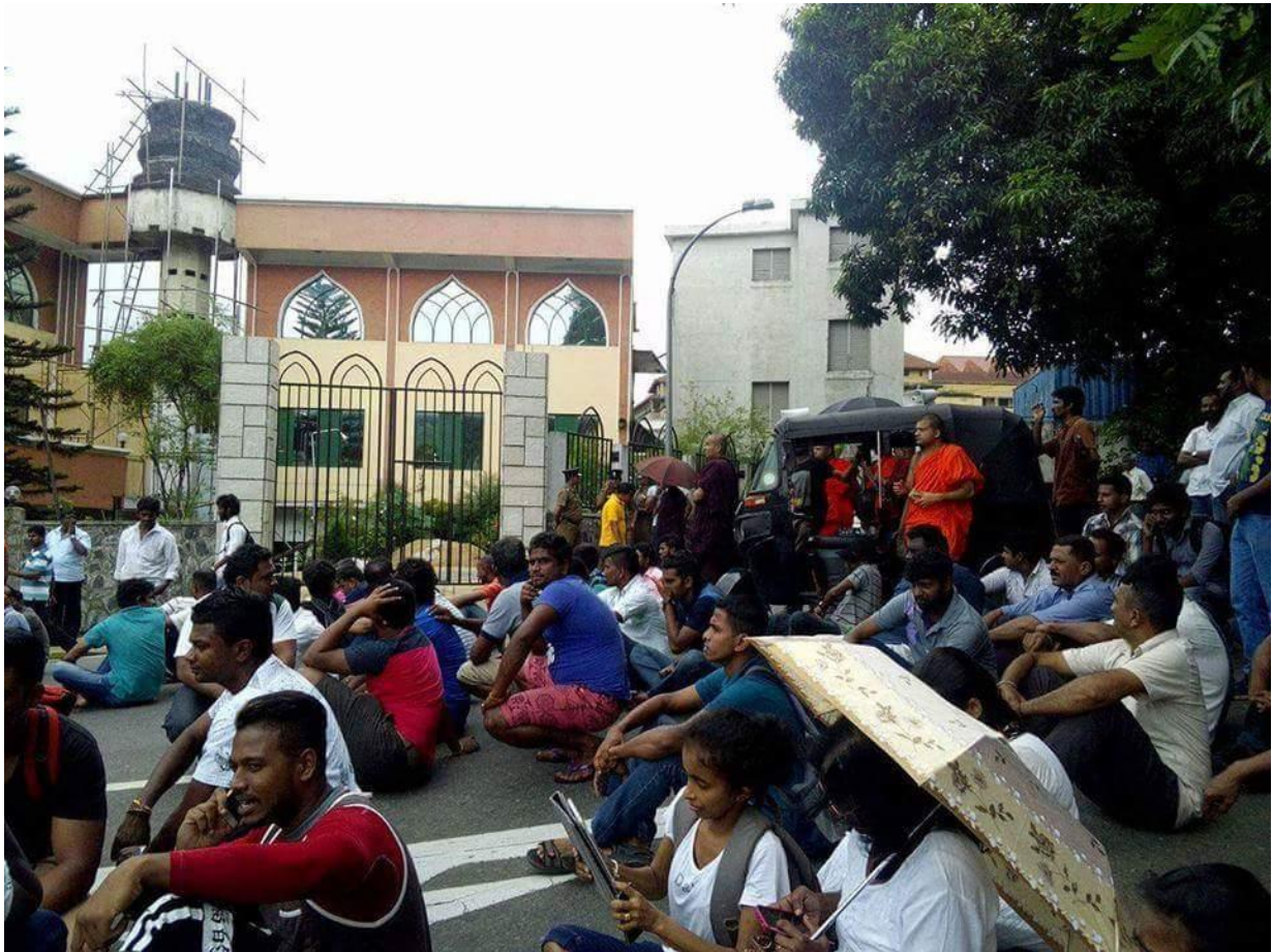
මෙම මුස්ලිම් පල්ලිය මහනුවර දළඳා මාළිගාවට වඩා උසින් වැඩි ලෙස ඉදි කෙරෙන බැවින් එහි ඉදිකිරීම් නවතා දමන ලෙස ඉල්ලමින් විරෝධතාවයේ නියැලුණු ‘සිංහලේ’ සංවිධානය ප්‍රමුඛ බෞද්ධ හික්මුන්. ඔවුන්ගේ විරෝධතාවයෙන් පසුව මෙහි ඉදිකිරීම් නතර කරන ලෙස නියෝගයක් නිකුත් කරන ලදී. 2016, ජුනි 5. මාධ්‍යවේදියා ෆෙස්බුක් පිටුවෙනි.

ආ ගමික අන්තවාදයන්ගේ වර්ධනය වර්තමානයේ දක්නට ඇති ප්‍රධානතම ගෝලීය ප්‍රවණතාවයකි. ශ්‍රී ලංකාව ද මෙම ප්‍රවණතාවයේ ගොදුරක් බවට පත් ව ඇති රටවල් අතරින් ප්‍රධාන රටකි. ශ්‍රී ලංකාව තුළ මෙය උච්ච ලෙස ප්‍රකාශමාන වූයේ 2014 සිදු වූ අලුත්ගම කෝලහාලය සමඟිනි. එවකට පැවති මහින්ද රාජපක්ෂ රජයේ නිල/නොනිල අනුග්‍රහය යටතේ වර්ධනය වූ බෞද්ධ අන්තවාදී කණ්ඩායම් සමාජ ජාල ඔස්සේ කරන ලද ප්‍රචාරයන් තුළින් මෙම ක්‍රියාව සාධාරණීකරණය කිරීමට උත්සහ දැරීම එකල ඉතා සුලබ සිදුවීමක් විය. මෙම ආගමික අන්තවාදයන්ගේ මතවාද රාජපක්ෂ ආණ්ඩුවේ දේශපාලන න්‍යාය පත්‍රය හා සමපාත වීම තුළ සිදු වූයේ ආගමික සුළුතරය දැඩි පීඩනයකට සහ හිංසනයකට ලක් වීමයි. මේ බව මනාව පැහැදිලිවන්නේ 2015 ජනාධිපතිවරණයේදී සුළු ආගමිකයින් බහුල ප්‍රදේශවලින් මහින්ද රාජපක්ෂ අන්ත පරාජයකට ලක් වීමය. එම මැතිවරණයේදී පොදු අපේක්ෂකයගේ අනපේක්ෂිත ජයග්‍රහණයට කේන්ද්‍රීය සාධකයන් ගෙන් එකක් වූයේ මෙම ආගමික