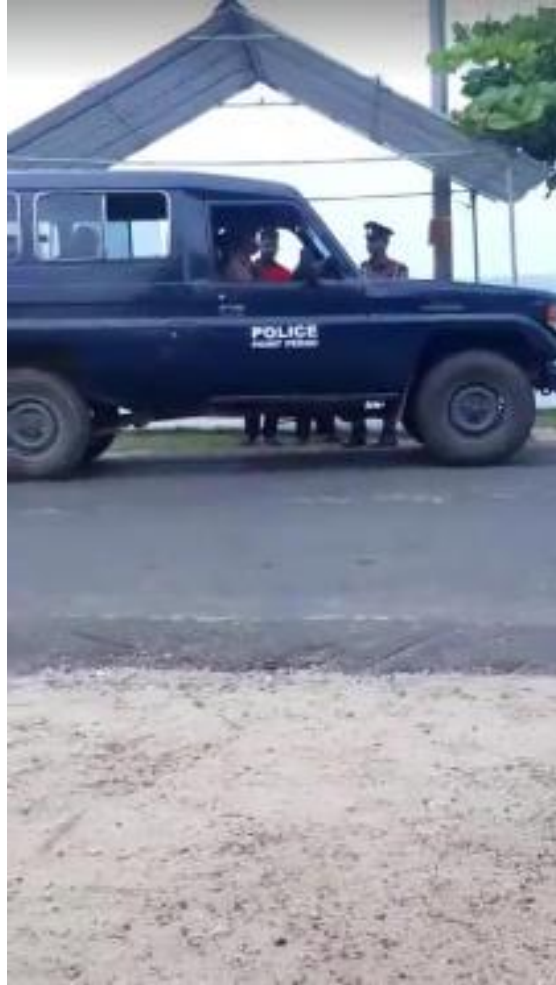
රූපය 5 : හානි කරන ලද නිවෙස (වමේ), ප්‍රදේශයේ සැරිසැරු පොලිස් කණ්ඩායම් (දකුණේ), පින්තූරය - ටැම්ල් ගාඩියන් www.tamilguardian.com

ජේදුරු තුඩුවේ මුනායි හි පැවැත්වීමට සූදානම් කර තිබූ මහවිරු සැමරුමේ සැරසිලි, කොඩි සහ වෙනත් පිළියෙල කිරීම් ප්‍රදේශයේ පොලීසිය විසින් නොවැම්බර් 27 වැනිදා විනාශ කර ඇත. ඊට පෙර ප්‍රදේශයේ අයට කියා තිබුනේ ඔවුන්ට උත්සවයට එක් රැස්වී පහන් දැල්වීමට හැකි බවයි. කෙසේ වුවත්, පසුව පොලීසිය ඔවුන්ට තර්ජනය කර, උත්සවයට කළ පිළියෙල කිරීම් සමහරක් විනාශ කර ඇත. “යුද්ධ කාලයේ නැති වුණු අපේ නැදැයන් සැමරීමට ඇති අපේ අයිතිය අපිට දුන්නේ නැහැ. රාජපක්ෂ ආපහු ආපු එක හින්දා තමයි මේ සීමාවන් ඔක්කොම ආවේ. ඒ වාගේම අපිට බයයි” යනුවෙන් සිද්ධියෙන් බලපෑමට ලක්වූ ජනතාව මාධ්‍යයට කියා ඇත. මේ අතර, සැමරුම් උත්සවයේ සංවිධානයකයාට පහර දුන් අතර, ඇතැමෙක් විශ්වාස කරන්නේ එය උත්සවය නැවැත්වීමේ අරමුණෙන් කරන ලද්දක් බවයි. 8