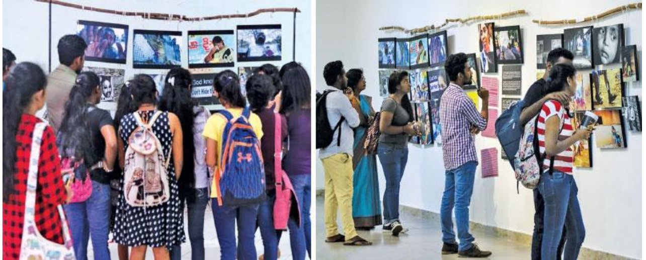
රූපය 8 - ප්‍රදර්ශනයේ අවස්ථා 2ක්, මාතර දී (වමේ), කොළඹ (දකුණේ), ඡායාරූපය - http://unframedsl.org/exhibition/

සිංහල භාෂාවෙන් කෙරෙන පුරවැසි මාධ්‍ය වේදිකාවක් වන විකල්ප වෙබ් අඩවිය විසින් සංවිධානය කරන ලද “Unframed” (“රාමු නොකළ”) ඡායාරූප ප්‍රදර්ශනය ජේරාදෙණිය සරසවියේ දී මෙසේ අවහිර කරනු ලැබුණි. ප්‍රදර්ශනයේ ශ්‍රී ලංකාවේ මනාව හිමිකම් ගැටළු සම්බන්ධ ඡායාරූප අඩංගු වූ අතර, එම ඡායාරූප එකතුව මීට පෙර කොළඹ දී, මීගමුවේ දී, මාතර දී, සහ අනුරාධපුර දී ප්‍රදර්ශනය කර තිබුණි. එය විශ්ව විද්‍යාලයේ සාහිත්‍ය ශාලාවේ දී ඔක්තෝබර් 16-18 අතර දිනවල ප්‍රදර්ශනය කිරීමට නියමිතව තිබුණි. එසේ වුවත්, වෛරී අදහස්, මරණ තර්ජන ආදිය ඔක්තෝබර් 15 දින සිට විකල්ප වෙබ් අඩවියට විරුද්ධව සහ එහි සංස්කාරක සම්පත් සමරකෝන් එරෙහිව එල්ල කරනු ලැබූ අතර, ප්‍රදර්ශනය මහජනතාවට විවෘත කරනු ලැබුවේ 16 වැනිදාය. ප්‍රදර්ශනය එල්ටීටීඊ-හිතවාදී එකක් යැයි සමහර ශිෂ්‍යයන් විසින් විවේචනය කරනු ලැබුණි. ප්‍රදර්ශනයට විරුද්ධ වන ශිෂ්‍යයන් තරයේ කියා සිටියේ එය නතර කළ යුතු බව යි. මේ වාතාවරණය යටතේ ප්‍රදර්ශනය පැවැත්වුණේ නැත. 14