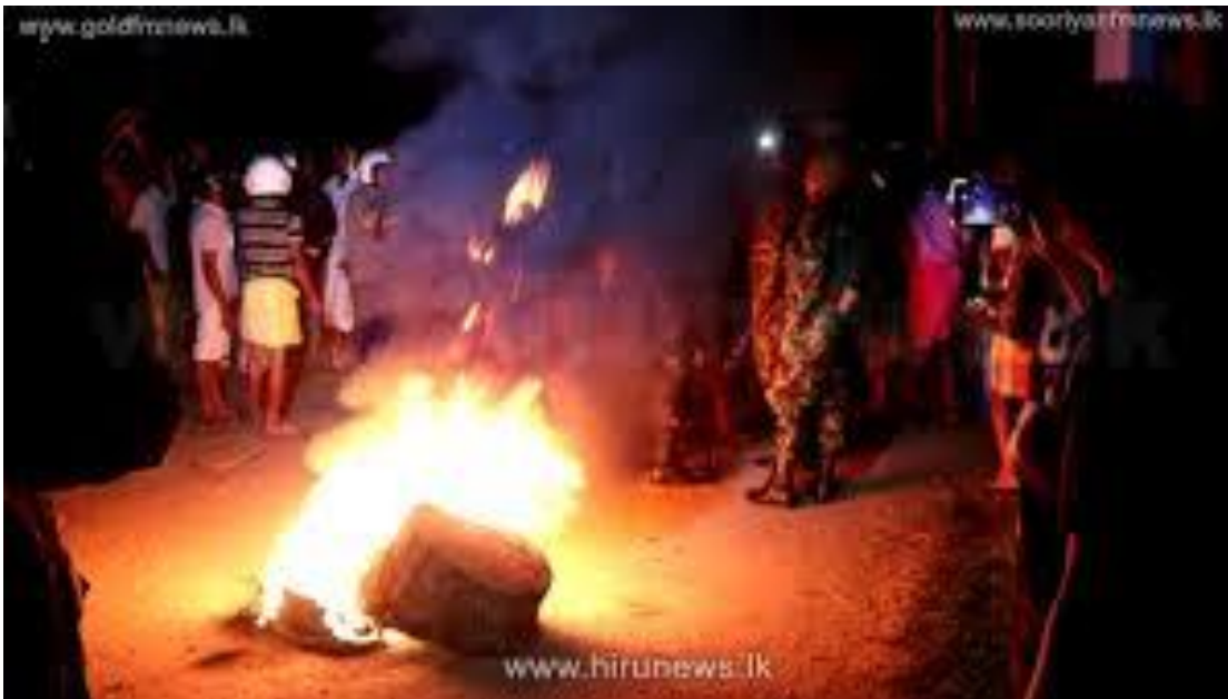
රූපය 12: කටුවන පොලීස් රැඳවුම් භාරයේ සිටියදී සිදු වූ මරණයට එරෙහි විරෝධතාවය

පොලීසිය විසින් කටුවන පොලීස් ස්ථානය ඉදිරිපිට දෙසැම්බර් 12 වැනි දින පැවැති උද්ඝෝෂණය විසුරුවා හැරීමට කඳුළු ගැස් භාවිතා කළ බවට වාර්තා වේ. විරෝධතාකරුවන් පොලීසියට චෝදනා කළේ පොලීස් අත්අඩංගුවේ සිටියදී පුද්ගලයකු මරා දැමූ බවයි. පොලීසිය මේ චෝදනාව ප්‍රතික්ෂේප කරන ලදී. පොලීස්