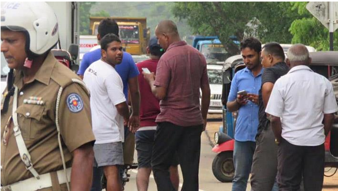
රූපය 11: දෙමළ ශිෂ්‍යයන්ට තර්ජනය කළ සිංහල කණ්ඩායම

යාපනයේ සිට අනුරාධපුරය දක්වා කිලෝමීටර 194ක දුරක් පයින් ඇවිද දෙමළ දේශපාලන සිරකරුවන් නිදහස් කරන ලෙස ඉල්ලූ දෙමළ ශිෂ්‍යයන්ට අනුරාධපුර බන්ධනාගාරය ඉදිරිපිට සිටි සිංහල කණ්ඩායමක් විසින් ඔක්තෝබර් 13 වැනිදා තර්ජනය කළ බවට වාර්තා වේ. කණ්ඩායම දෙමළ සිසුන් වෙත පැමිණ තර්ජනය කරමින්, චෝදනා කර ඇත්තේ එල්ටීටීඊය නියෝජනය කරන බවට ශිෂ්‍යයන්ට චෝදනා කරමිනි. “උඹලා එල්ටීටීඊය වෙනුවෙන් ආවා නම් මෙතනින් යනවා හොඳයි, එල්ටීටීඊකාරයෝ ඉන්නවා නම් ඉස්සරහට එන්න” යැයි සිංහල පිරිමි කණ්ඩායම පවසා ඇත. ශිෂ්‍යයන් එවිට අසා ඇත්තේ තවමත් එල්ටීටීඊය සිටිනවාද යන්නයි. එවිට ඔවුන්ට කටපියා ගන්නා ලෙසත් “අද රැට මාධ්‍යවලින් කිව්වොත්, උඹලා එල්ටීටීඊ වෙනුවෙන් ආවා කියලා උඹලා ඉවරයි”. පොලිස් නිලධාරීන් සහ බන්ධනාගාර නිලධාරීන් ඒ අවස්ථාවට පැමිණ ඇතත් මැදිහත් වී නැත. මේ ගැන විඩියෝ ක්ලිප් එකක් ඉලෙක්ට්‍රොනික් සහ සමාජ මාධ්‍යවල පළ විය. 17