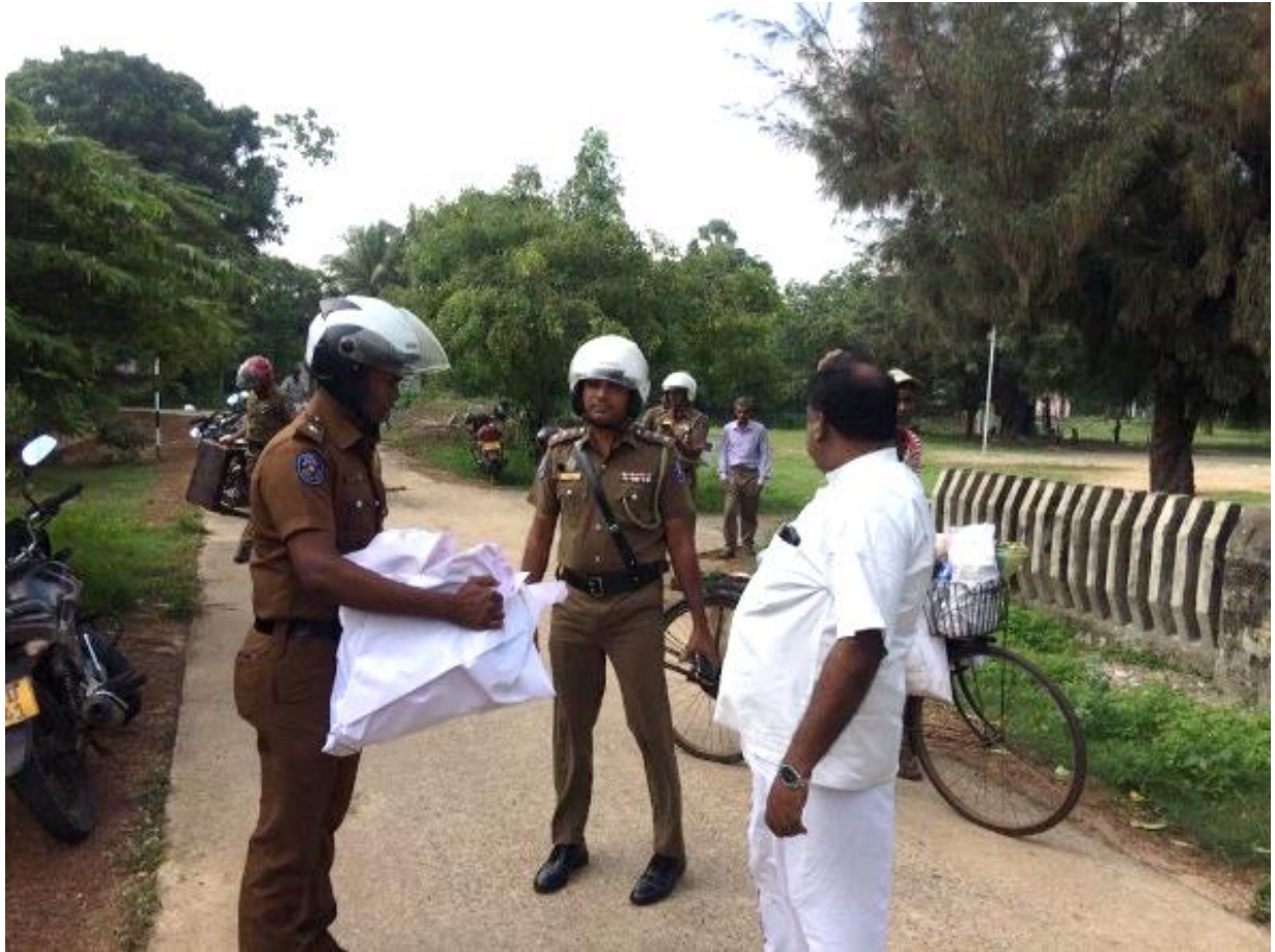
රූපය 3: උතුරු පළාත් සභා මන්ත්‍රී ශිවාජ්ලිංගම් අත්අඩංගුවට ගනිමින්-ඡායාරූපය- ටැම්ල් ගාඩියන්- https://www.tamilguardian.com

හිටපු උතුරු පළාත් සභා මන්ත්‍රී, එම් කේ ශිවාජ්ලිංගම් විසින් එල්ටීටීඊ නායක වී ප්‍රභාකරන්ගේ උපන්දිනය වැල්වැටිතුරෙයි පිහිටි ඔහුගේ මහගෙදර ආසන්නයේ සැමරීමට උත්සහ කිරීමේ දී ශ්‍රී ලංකා පොලීසිය විසින් අත්අඩංගුවට ගෙන ඇත. ඔහු අත්අඩංගුවට ගෙන ඇත්තේ කේක් ගෙඩියක්, ඉට්පන්දම් සහ තවත් භාණ්ඩ කිහිපයක් සමග වෙත අතර, පසුව නිදහස් කරනු ලැබිණි. ඒ අතර තරුණයන් සිව් දෙනෙක් ද එදින උදේ පොලීසිය විසින් අත්අඩංගුවට ගෙන ඇත්තේ ප්‍රභාකරන්ගේ නිවස අසල පඳුරු කපා ඉවත් කරමින් සිටියදීය. අත්අඩංගුවට ගැනීම් සම්බන්ධයෙන් වාර්තා කළ ජනමාධ්‍යවේදීන්ට පොලීසිය විසින් ප්‍රදේශයෙන් ඉවත්ව යන ලෙස තර්ජනය කර, ඔවුන්ගේ ඡායාරූප ගෙන ඇත. 6