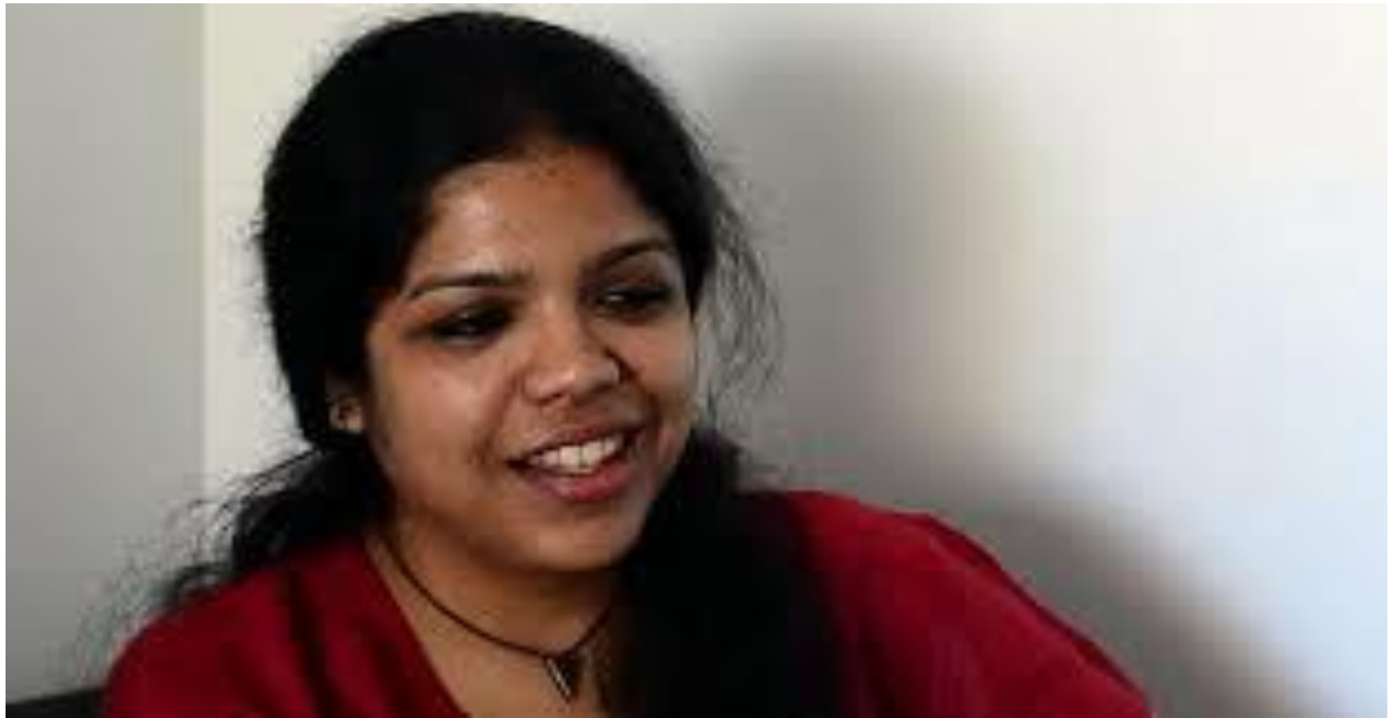
රූපය 7 - මීරා සිරිනිවාසන්

කැබිනට් අමාත්‍යවරයකු සහ එක්සත් ජනතා නිදහස් සන්ධානයේ මහලේකම් ඉන්දියානු ජනමාධ්‍යවේදිනී මීරා සිරිනිවාසන්, ඉන්දීය ද හින්දු පුවත්පතේ කොළඹ වාර්තාකාරිනියට වෝදනා එල්ල කරමින් කියා සිටියේ ඇයට ඉන්දීය RAW රහස් ඔත්තු සේවය සමඟ සම්බන්ධකම් ඇති බවයි. ඇය පුවත්පතට වාර්තාවක් ලියමින් ජනාධිපති මෛත්‍රීපාල සිරිසේන විසින් කැබිනට් රැස්වීමක් අමතමින් ඉන්දීය RAW ඔත්තු සේවය විසින් ඔහුව ඝාතනය කිරීමට සැලසුම් කරන බවට වෝදනා කළ බවට ඇය පුවත්පතට ලිපියක් ලියා ඇත. 11 මේ වාර්තාව ජනාධිපති විසින් ප්‍රතික්ෂේප කළ අතර, හින්දු පුවත්පත ප්‍රකාශ කළේ අදාළ කැබිනට් රැස්වීමට සහභාගි වූ ඇමැතිවරු සිව්දෙනෙක් මේ සිද්ධියේ සත්‍යභාවය තහවුරු කර ඇති බවයි. නිදහස් මාධ්‍ය ව්‍යාපාරය ප්‍රකාශ කළේ අමාත්‍යවරයාගේ ප්‍රතිවාර පදනම් විරහිත වෝදනා බවත්, පිළිතුරු දීමට ඇති අයිතියෙන් ඔබ්බට ගොස් හිරිහැර කිරීමේ අදහසින් එය ප්‍රකාශ කර ඇති බවත්, මාධ්‍ය නිදහස සහ ප්‍රකාශනයේ නිදහස උල්ලංඝනය කරන බවත්ය. 12