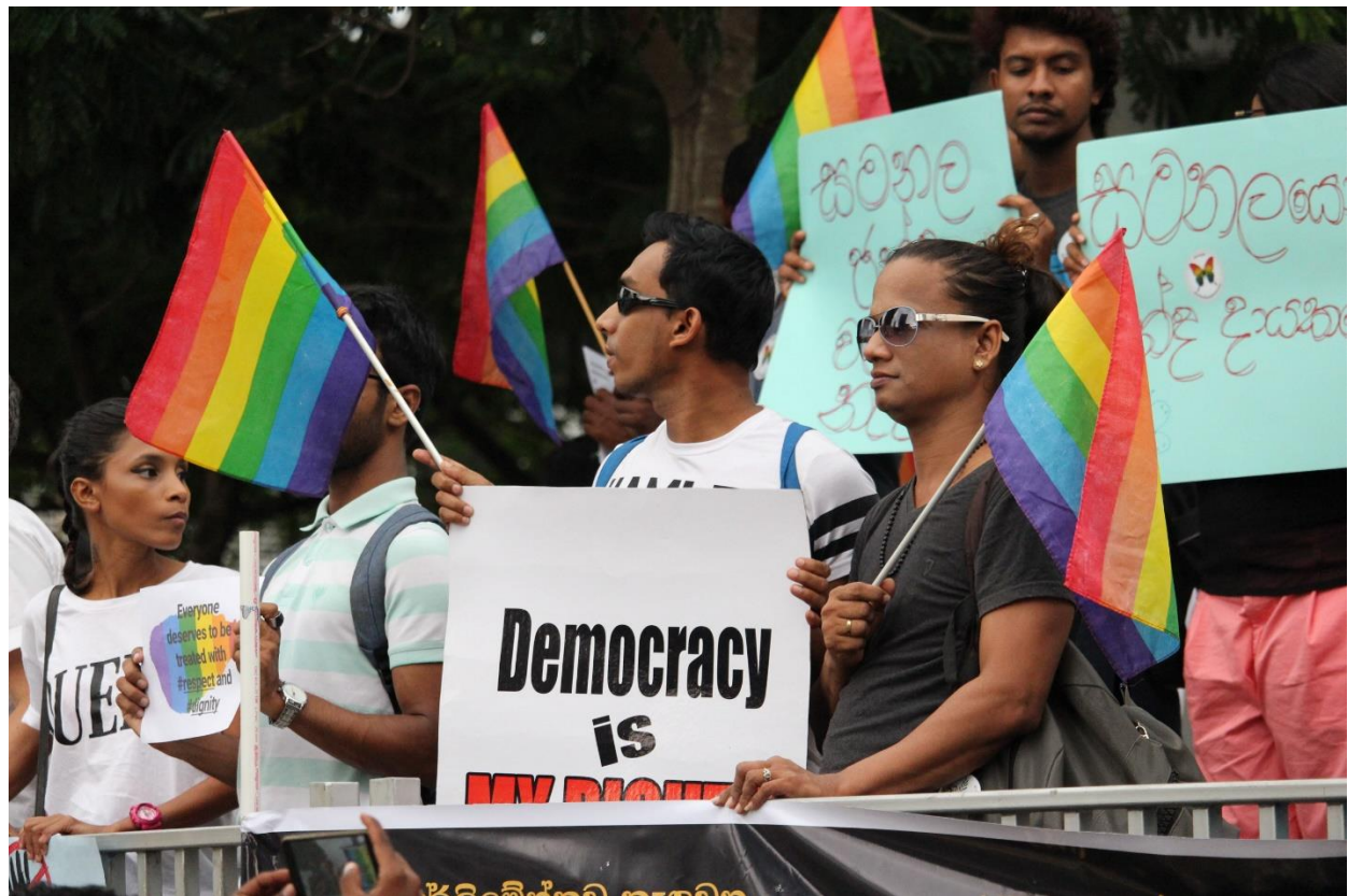
රූපය 17: LGBTIQ ප්‍රජාව සහ අනෙකුත් අය ජනපතිගේ සමලිංගික භීතීකාවෙන් යුතු අදහස් දැක්වීමට සහ සිදුවන දේශපාලනික අර්බුදය සම්බන්ධයෙන් විරෝධතාවය දක්වමින්, ඡායාරූපය: බකමුණෝ bakamoono.lk

ජනාධිපති මෛත්‍රීපාල සිරිසේන විසින් සමලිංගික-ද්විලිංගික-සංක්‍රාන්තිසමාජභාවී-අන්තර්ලිංගික-කුයර් (LGBTIQ) ප්‍රජාව සම්බන්ධයෙන් මතු කළ අදහස් සම්බන්ධයෙන් සංවිධාන කිහිපයක් විසින් තදබල දෝෂාරෝපණය කිරීමට ලක් කර ඇත. ජනාධිපති එක්සත් ජනතා නිදහස් සංධානයේ (එජනිස) රැළියක් නොවැම්බර් 5 වැනි දින අමතමින් කියා සිටියේ අගමැති රනිල් වික්‍රමසිංහ “සමනල ජීවිතයක්” ගත කළ බවත්, රජයේ තීරණ ගත්තේ ඔහුගේ “සමනල නඩය” විසින් බවත්ය. මේ අදහස් සමලිංගිකභීතීකාවෙන් යුතුව ඉදිරිපත් කළ අදහස් සේ පෙනුණු අතර, LGBTIQ ප්‍රජාවට අපහාසාත්මක ලෙස ඉදිරිපත් කර තිබුණි. මේ අදහස්වලට විරුද්ධව LGBTIQ ප්‍රජාව විසින් සහ අනෙකුත් අය විසින් එකතු වී විරෝධතා දැක්වූ අතර, එයින් “ප්‍රජාතන්ත්‍රවාදය උදෙසා සමනලයෝ” යන කණ්ඩායමේ බිහිවීම ද ඇති විය. 29