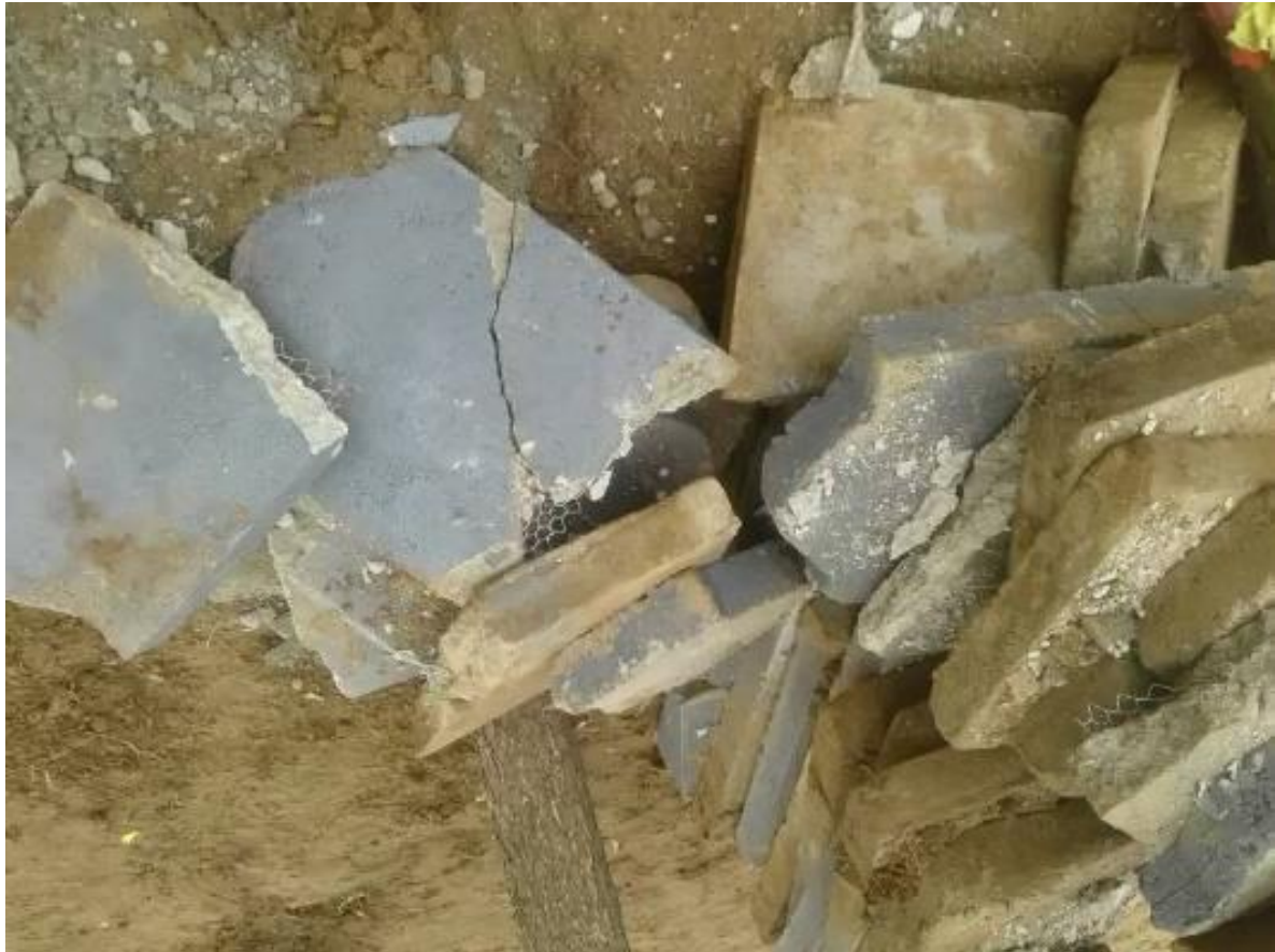
රූපය 4 : ඉවත් කළ සොහොන්

මඩකලපුවේ වාකරේ පිහිටි කණ්ඩලඩ් එල්ටීටීඊ සුසාන භූමියේ සැමරුම් උත්සවයක් සඳහා පැමිණි පුද්ගලයන්ට අලුතෙන් පිහිටවූ සොහොන්කොත් ඉවත් කිරීමට පොලීසිය විසින් බලකර ඇත. මූලින් තිබූ සෙහොන් වලවල් 2007 වසරේ දී හමුදාව විසින් විනාශ කර ඇති අතර, අලුත් සොහොන් කොත් සාදා ඇත්තේ මැතදිය. “සාම්ප්‍රදායික සිහිපත් කිරීමේ ගීතය වාදනය කිරීමට අපට ඉඩ දුන්නේ නැහැ. රතු සහ කහ කොඩි පාවිච්චි කිරීම තහනම් කළා යැයි සහභාගි වූවෝ පැවසූහ. ඔවුන් එසේම කීවේ පොලීසිය ඔවුන්ට සාමකාමී ලෙස සැමරුම් උත්සවය පැවැත්වීමට ඉඩ නොදුන් බවත්, ඉතා ඉක්මනින් උත්සවය නැවැත්වීමට සිදු වූ බවත්ය. 7