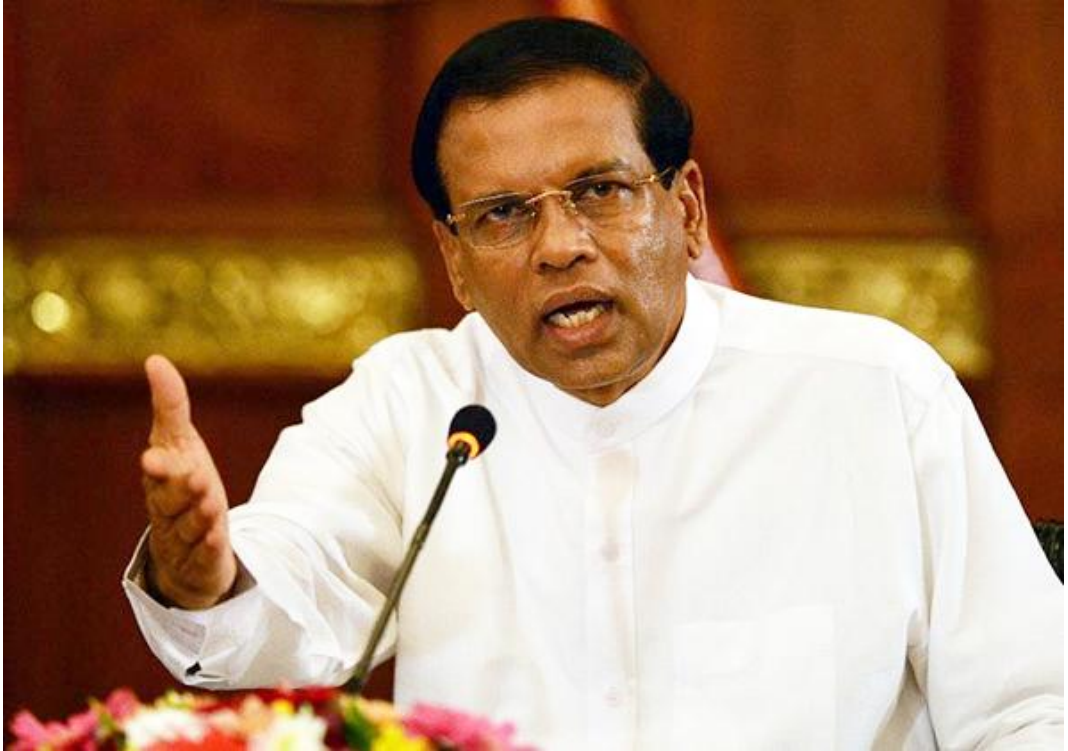
(பிரதிமை - ஜனாதிபதி மைத்திரிபால சிறிசேன)