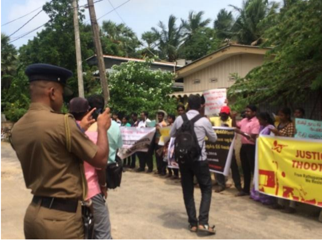
(பிரதிமை - போராட்டக்காரர்களைப் பொலிசார் அலுவலர் ஒருவர் புகைப்படமெடுக்கிறார்)

இந்தியா, தமிழ்நாடு, தூத்துக்குடியில் சிவிலியன்களைச் சுட்டதற்கு எதிராக ஜூன் 1 அன்று யாழ்ப்பாணத்தில் இந்தியத் துணைத் தூதுவராலயத்தின் முன்னால் போராட்டமொன்றில் போராட்டக்காரர்கள் ஈடுபட்டிருந்தனர். அவ்வேளையில், இலங்கையின் பொலிசாரினாலும், துணைத் தூதுவராலயத்தின் பாதுகாப்பு அலுவலர்களினாலும் தாம் அனாவசியமாகப் புகைப்படம் பிடிக்கப்பட்டதாக அவர்கள் வலியுறுத்துகின்றனர். 3