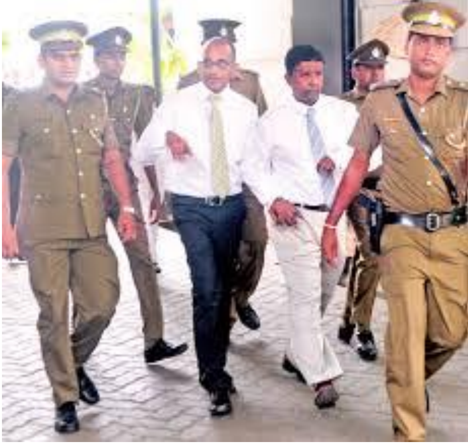
(பிரதிமை - கைது செய்யப்பட்ட அரசு அதிகாரிகள் சிறைச்சாலை அலுவலர்களினால் விளக்கமறியலுக்கு அழைத்துச் செல்லப்படுகின்றார்கள்)

18. ஒரு தாபனத்தின் தவறுகளை வெளிப்படுத்திய இந்திய முதலீட்டாளருக்கு மரண அச்சுறுத்தல்