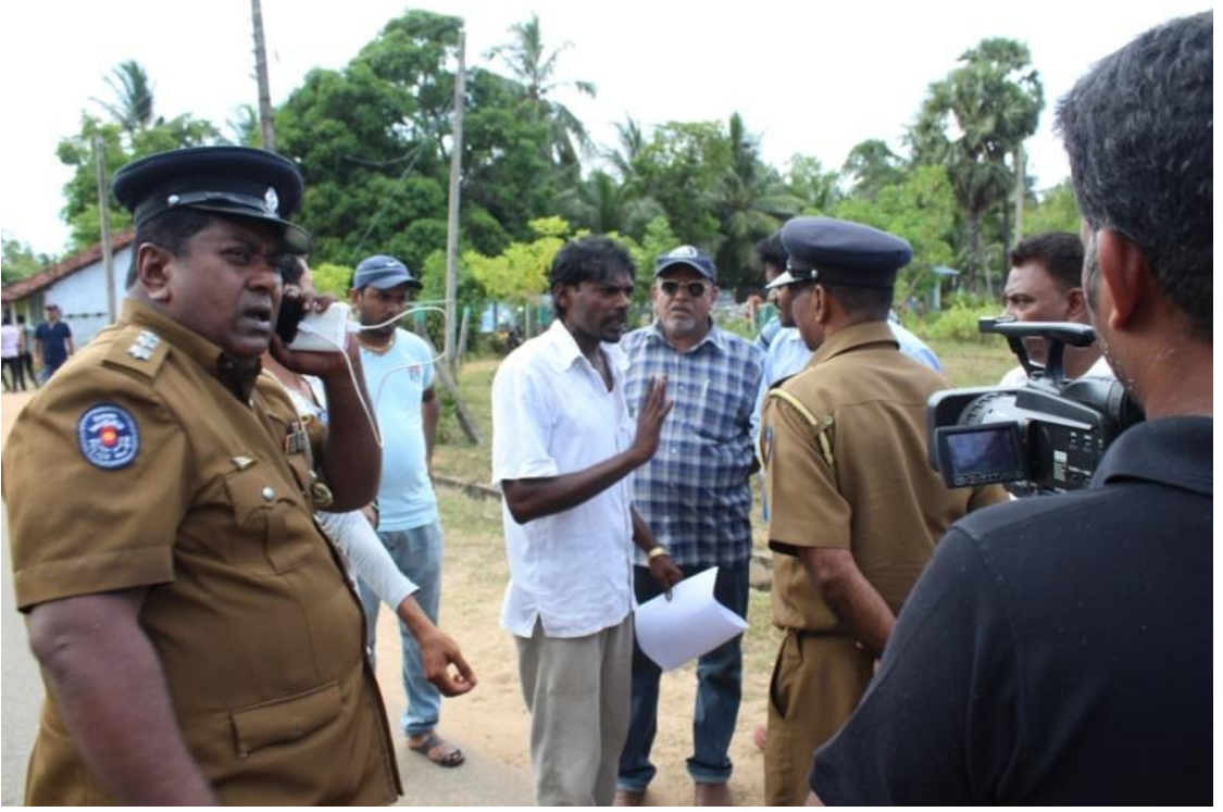
(பிரதிமை - போராட்டத்தை நிறுத்துவதற்கு பொலிஸ் அலுவலர்கள் முயல்கின்றனர்)